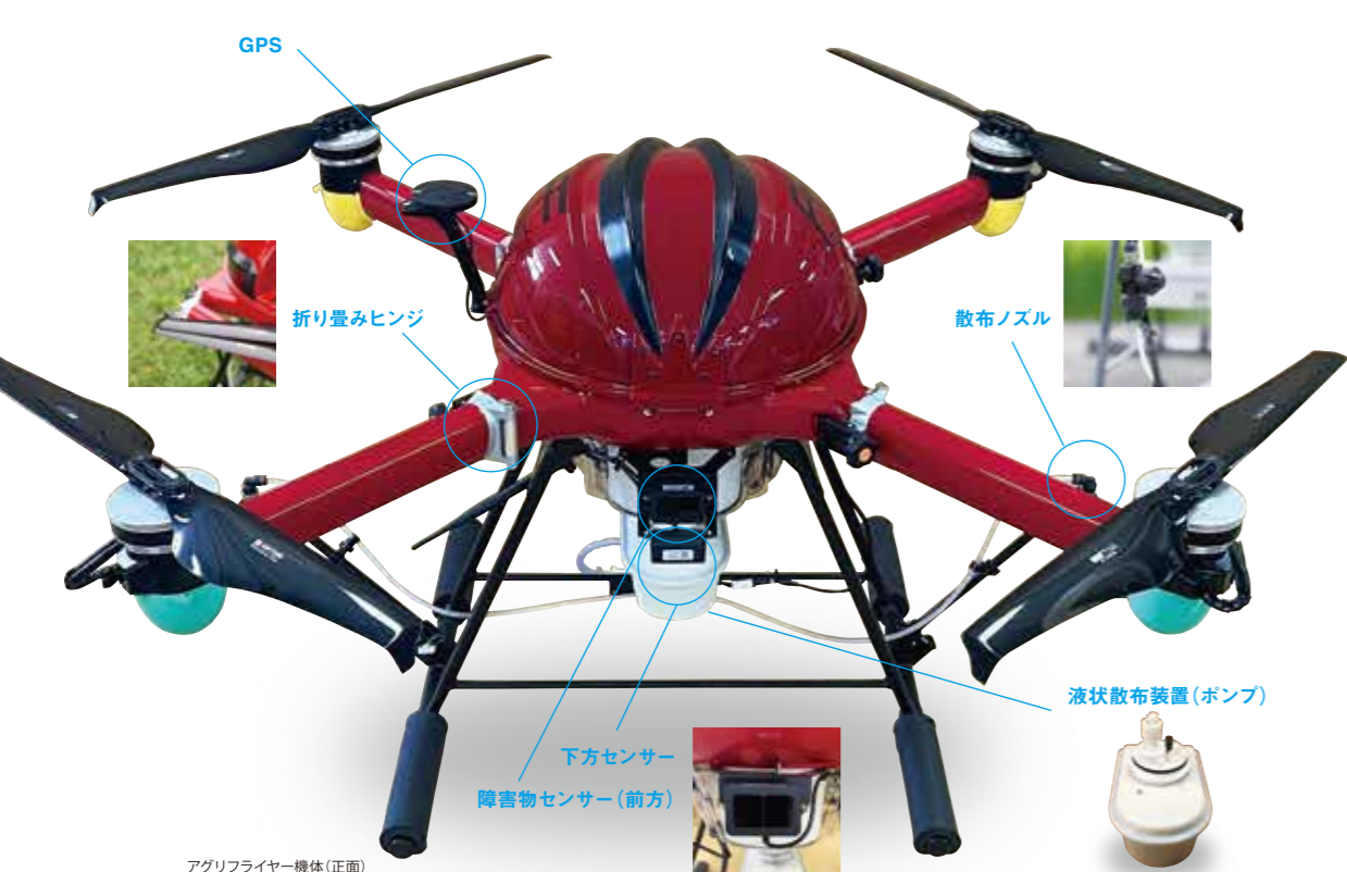
アグリフライヤー機体(正面)